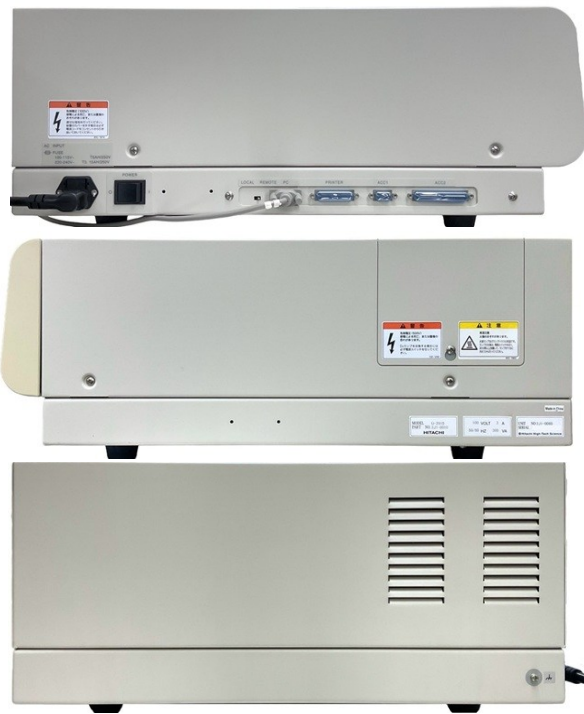
【装置側面-1,2および背面】