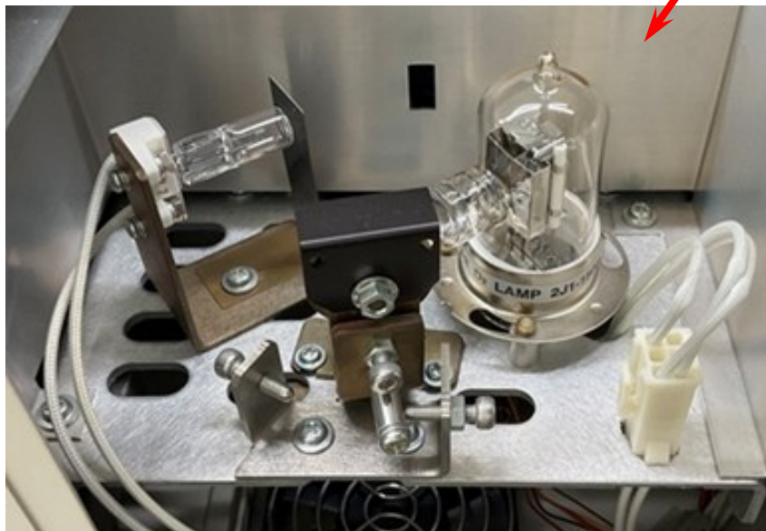
【装置内部ランプ = 状態良好】