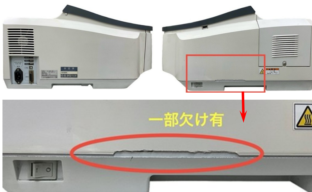
【装置側面-1,2と微小欠け部】