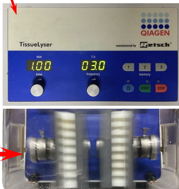
【表示パネル部拡大】