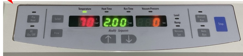
【表示部拡大, ロータ RH64-11, 予備トラップ瓶】