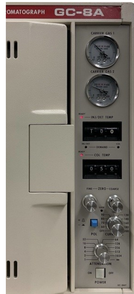
【ガス圧表示部拡大】