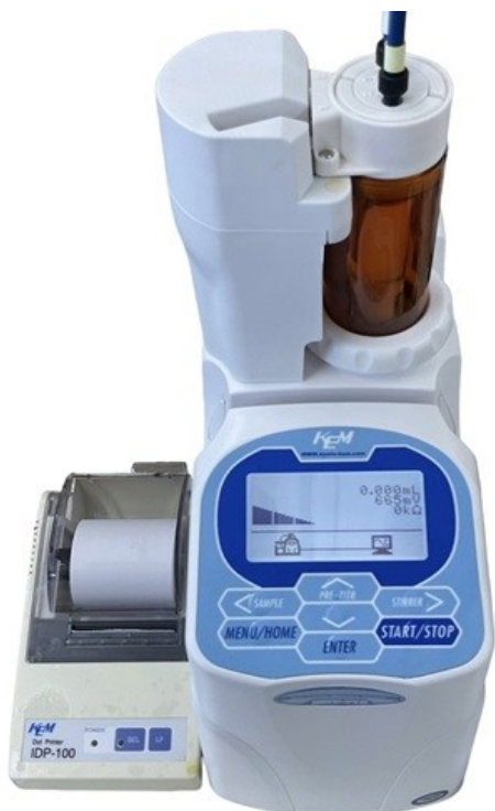
【送液ユニット + プリンター】