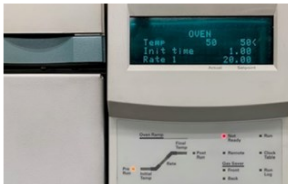
【表示部とガス接続部】