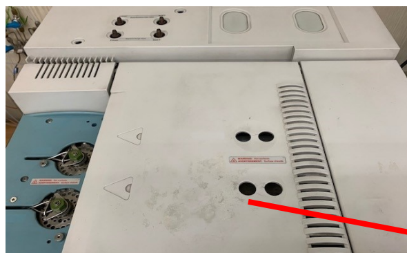
【装置上面と注入口】