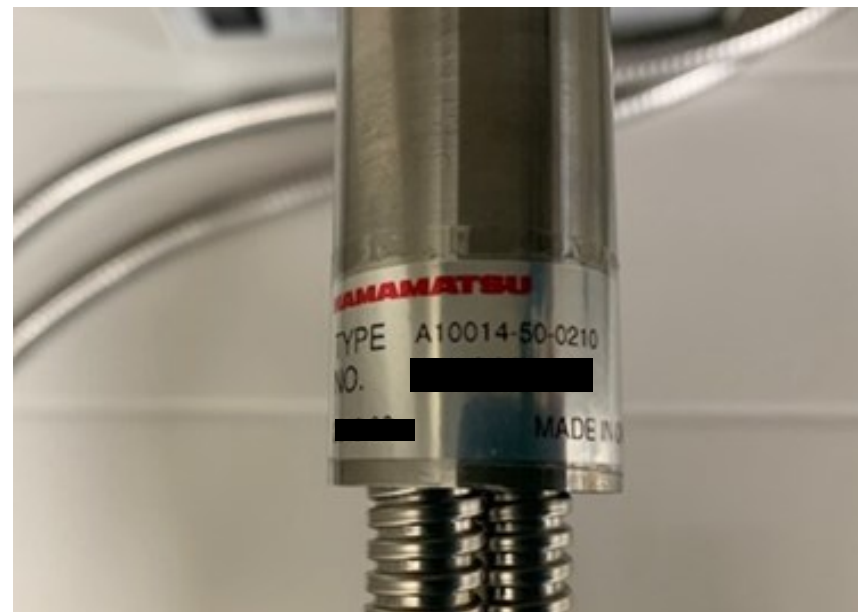
【光源ユニット拡大】